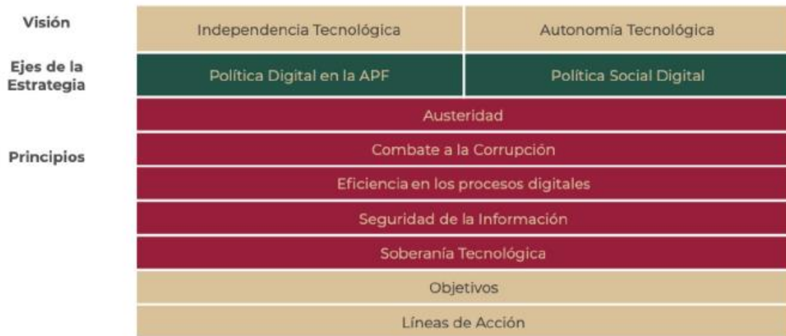
Figura 3. Marco estructural de la EDN

Los dos objetivos generales de la estrategia se componen de nueve objetivos específicos y líneas de acción identificadas como relevantes en materia de tecnologías, gobierno digital, conectividad, inclusión digital, software libre ii , estándares abiertos, digitalización de trámites, sistemas e infraestructura interoperables y seguridad de la información, que orientan el quehacer de las dependencias y entidades para dar sentido, unicidad y congruencia a esta Estrategia, cuya finalidad es una transformación centrada en las y los ciudadanos.