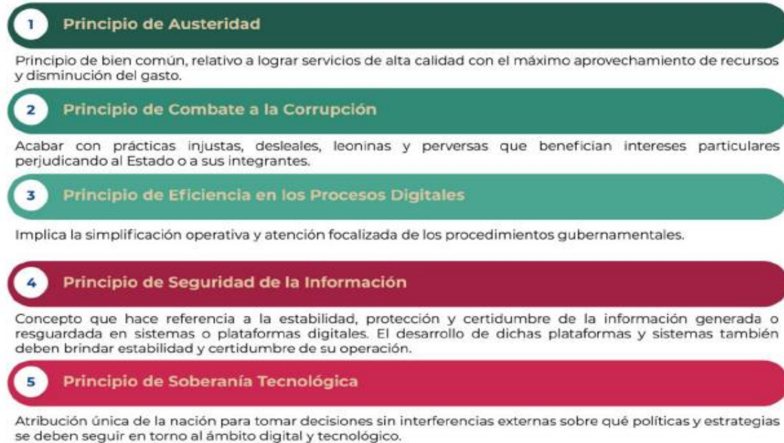
Figura 1. Principios de la EDN

La EDN aterriza las capacidades gubernamentales en la prioridad de atender los planteamientos de una adecuada gobernanza tecnológica, la mejora de los servicios digitales y la optimización de los procesos, enmarcando dichos propósitos en los siguientes principios: